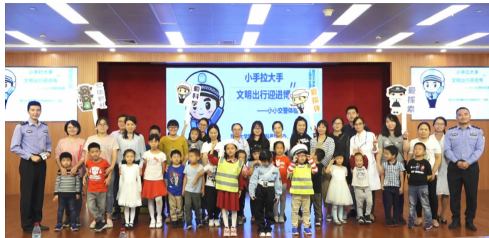
(文/党办 楼昀 团委泰怡)

个个争先恐后、跃跃欲试,有模有样做着CPR为小伙伴包扎,专业急救员还带着孩子们参观了急救车,小小急救员们难掩兴奋之情。交警总队出行专家为孩子们带来了实用又有趣的交通安全讲座,讲解了多种违章行为的危害并演示了正确做法,让孩子们印象深刻,互动环节气氛热烈,人人举手抢答。交警总队出行专家为孩子们带来了实用又有趣的交通安全讲座,讲解了多种违章行为的危害并演示了正确做法,让孩子们印象深刻,互动环节气氛热烈,人人举手抢答。交警总队出行专家为孩子们带来了实用又有趣的交通安全讲座,讲解了多种违章行为的危害并演示了正确做法,让孩子们印象深刻,互动环节气氛热烈,人人举手抢答。