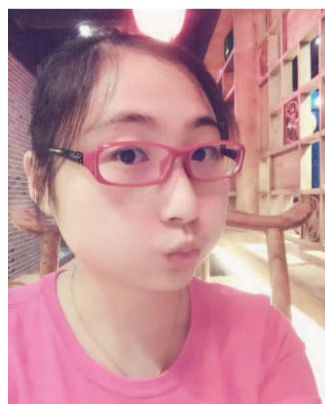
向往，能够守护、呵护这些襁褓中的稚婴，带着新手爸妈步入正轨，那些流淌着弯着腰的“累”都是值得的。 (文/21病区 秦敬琴)

生活总是由无数的琐碎拼凑而成，就如同忙碌的病房里各种声音所弹奏出的关于呵护生命的乐章。新生命的孕育、诞生，伴随而来的或喜悦，或忧虑，或手忙脚乱，在这一张张期待、紧张的面孔下，我们母婴同室的日常拉开一个忙而不乱的序幕。 交接班后，进入状态。整理床铺、流通空气，给我们的宝宝们妈妈们创造一个整洁温馨的生活环境，紧接着大家分工合作开始给宝宝沐浴、脐带带火、注射疫苗、抚触，给妈妈们测量血压、听胎心、做胎心监护。对一些有异常的孕产妇做一些必须的治疗。之后，新入院的“大大反”们陆续的到来，带着各种各样的“问题”，核对接待、询问病史办理入院、安排床位、入院宣教、通知医生、执行医嘱，一步一步井然有序。同时，当天进行剖宫产术或者