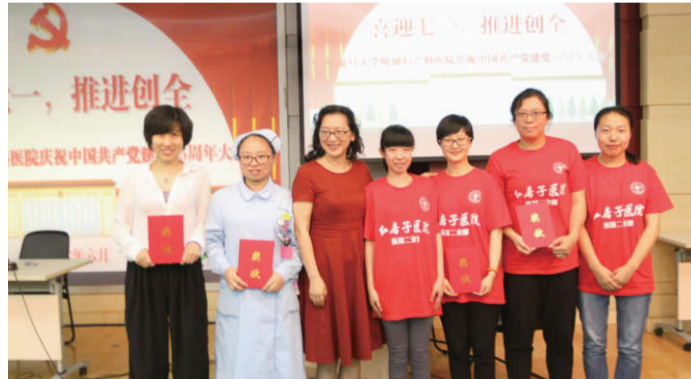
▲知识竞赛“最佳辩论队”上台领奖