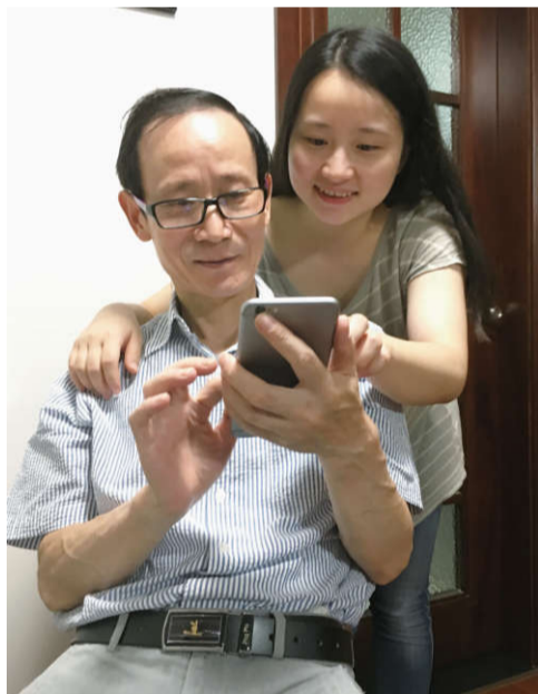
自从有了微信，亲戚们迅速地集结了各种微信群：大家族一个群、长辈一个群、小辈一个群、弟兄们一个群、姐妹们一个群、发红包一个群等等。爸爸一直是其中的异类，他用着五六年前装宽带时捆绑贩售的手机，笑我说：“你们啊，都

被手机绑架了，走路看手机、吃饭看手机，一刻都停不了。”爸爸觉得好有道理，我没办法反驳，不用智能手机无非就是不能微信聊天刷微博支付宝等等而已嘛，对老年人的生活好像也没有特别大的影响。