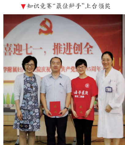
▲知识竞赛“最佳辩手”上台领奖