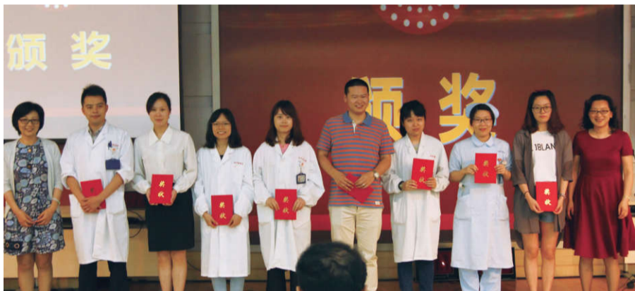
▲“优秀团员”上台领奖