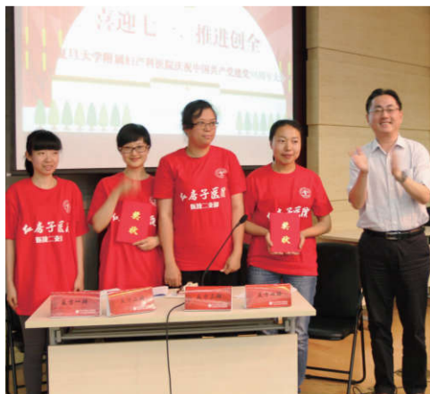
▲知识竞赛“最佳辩论队”上台领奖