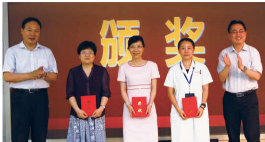
▲优秀共产党员代表上台领奖

“6月30日,我院建党95周年暨“喜迎七一,推进创全”趣味知识竞赛在杨浦区隆重举行。上海市卫生计生委主任邬惊雷、上海市文明办活动指导处处长丁小硕、上海市卫生计生委新闻宣传处处长、文明办主任王彤、上海市卫生计生委新闻宣传处副处长、文明办副主任俞军、复旦大学医院管理处处长伍蓉以及我院院领导、老专家代表、统战人士代表和全院中共党员代表共200余人出席了大会。