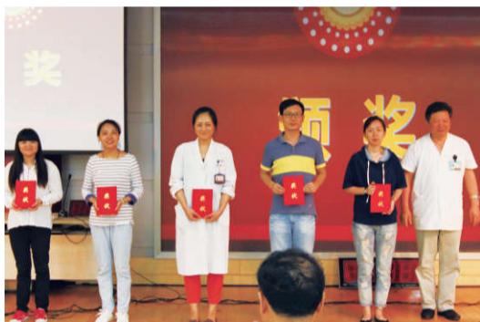
▲优秀团干部上台领奖