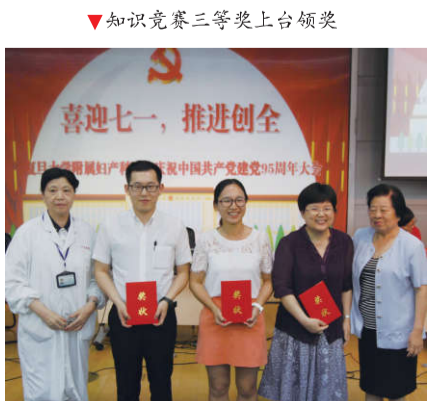
▲知识竞赛三等奖上台领奖