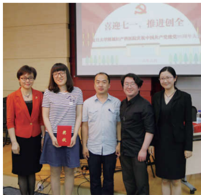
▲知识竞赛一等奖上台领奖