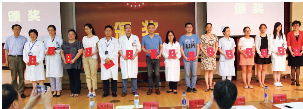
▲“优秀共产党员”上台领奖