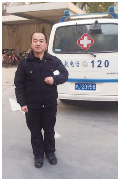
对大部分医务人员来说，医疗急救，既熟悉又陌生，熟悉的是其急救知识和救护车在马路狂奔的影子，陌生的是急救人员的真正工作