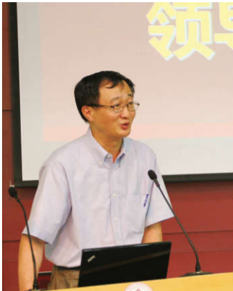
▲上海市卫生计生委主任邬惊雷讲话