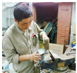
16:00 技工师傅还在维修着仪器，特殊的工作性质使得他们往往在别人休息的时候开始工作