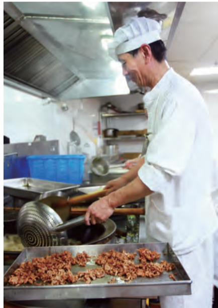
9:20 地下一层的食堂厨房里，厨师、点心师傅们正忍受着高温，辛勤耕耘着，为全院职工准备着一天的食粮