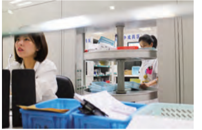
9:47 中西医药房的工作人员严谨又迅速地为病人提供相应的药品