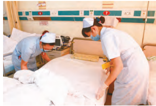
7:50 护士们交班接受，分批来到病房，为病人铺床，换上干净、舒适的新床单、新枕套。