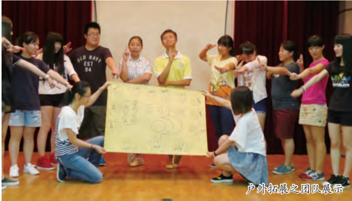
户外拓展之团队展示