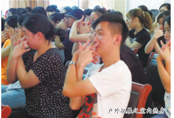
户外拓展之室内热身