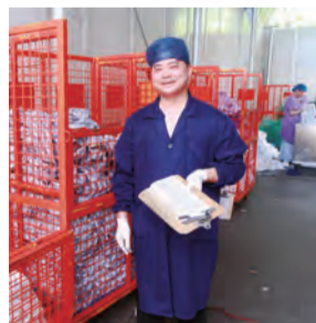
13:30 医疗废弃物处的工作人员们顶着烈日，不畏艰苦，分门别类地处理着医疗废弃物