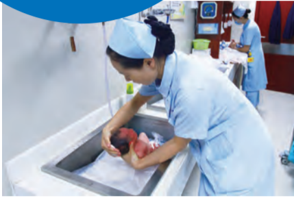
8:10 产科护士开始为新生儿洗澡！在亲切的护士阿姨手中，宝宝们安静地睡着，享受她们轻柔的爱抚，然后干干净净地回到妈妈身边