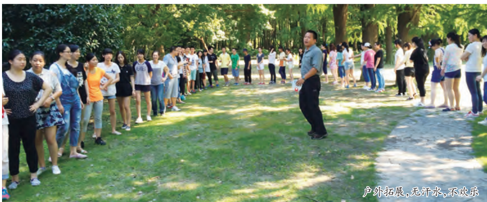
户外拓展，无汗水，不欢乐