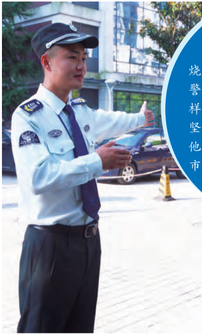
7:00 当大多数人还赖在被窝，当魔都渐渐苏醒，保安小哥们早已穿好挺括的制服，精神抖擞地站在各自的岗位上，或为车辆引路，或为车主递卡，或为病人指路

近日，魔都正式开启“高温烧烤”模式，38度的高温橙色预警让人直呼“伤不起！”就是在这样的高温“烤”验下，还有许多人坚守在炽热的烈日下辛勤工作，他们默默无闻，甘做维护整座城市正常运转的一颗齿轮。