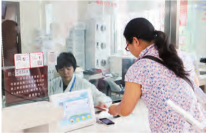
9:55 门诊大厅与出入院室收费处的工作人员们热情地为病人提供服务