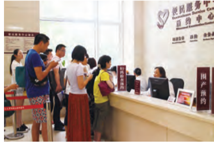
8:30 院门口的便民服务中心和预检台格外热闹，早就排起了“长龙”，工作人员们笑容灿烂，耐心地为每一位访客服务