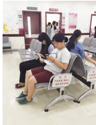
仁心,为职工们在今后的工作中做好医患沟通打下了良好的基础。

此次活动是我院继“今天我就诊之走出去做患者,亲历谈感受”后,开启的一项职工体验活动。通过就诊体验,红房子新人们感受到了完整的门诊就医流程,在熟悉医院环境的同时,站在患者角度审视医院,感同身受患者就医过程中遇到的难题,了解医务人员的医者