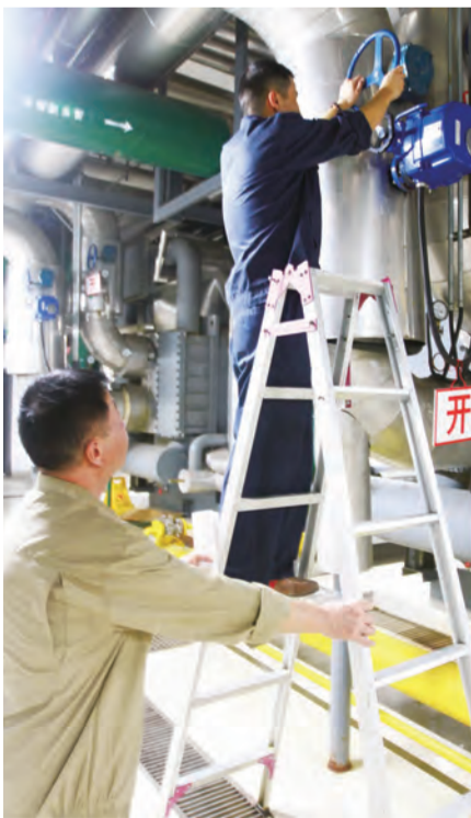
13:45 空调机房里闷热异常，噪声轰鸣，工作人员们还在辛苦地操作着仪器