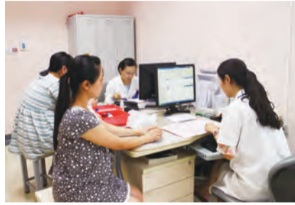
8:13 产科门诊的候诊大厅中坐满了一位位准妈妈，产科医生们仔细询问孕妇情况，为宝宝的顺利诞生保驾护航