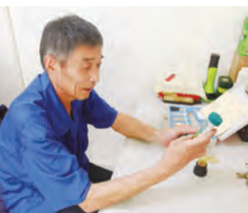
17:00 污水处理处的师傅还在岗位上，忍受着酷暑的同时，他已对地下室飘来的臭味习以为常，尽责地做着氯气检查