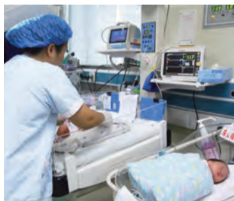
11:20 新生儿科的医生们仔细记录着每一位宝宝的情况，护士们贴心地护理着小宝贝们