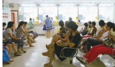
10:12 抽血室内人满为患，负责抽血的护士们熟练又小心地为病人抽血