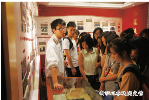
新职工参观院史馆