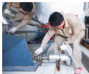
15:00 室外温度37度，而锅炉房内的温度却达到了55度，在如此炎热的环境下，工作人员还在认真地检查设备，工作服早已湿透