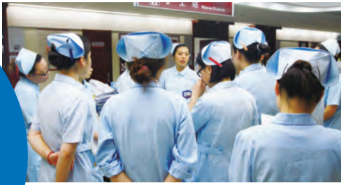
7:30 “白衣天使”们一早就忙活了起来，妇科护士正在交班，陈述本病区的患者总数、本班新入院人数及所患疾病、病危人数、今日出院患者、昨日手术及特殊检查完成情况、当日手术及特殊检查准备情况等，保证护理工作的延续性

近日，魔都正式开启“高温烧烤”模式，38度的高温橙色预警让人直呼“伤不起！”就是在这样的高温“烤”验下，还有许多人坚守在炽热的烈日下辛勤工作，他们默默无闻，甘做维护整座城市正常运转的一颗齿轮。