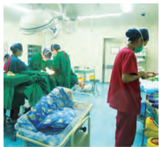
10:27 产房手术室内正在进行一台剖宫产术，3位医生、2为助产士、1位麻醉师、1位儿科医生都为新生命的降临而忙碌着