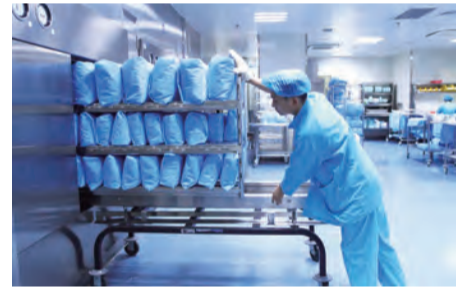
9:35 同样位于B1的供应室里，工作人员们正储备着各种医用物品