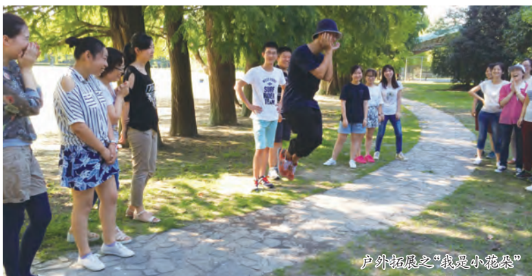
户外拓展之“我是小花朵”