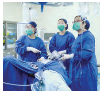
14:10 妇科手术室内，医生们正在一丝不苟地进行腹腔镜手术，双眼紧紧盯着屏幕