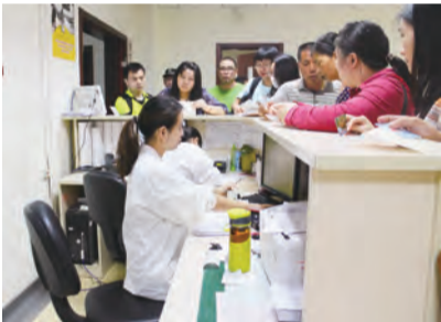
9:15 B 超室的工作人员也在紧张地忙碌着