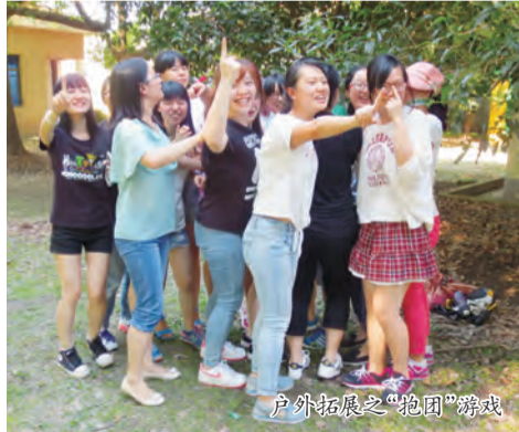
户外拓展之“抱团”游戏