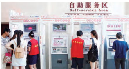
15:30 几位特殊的红房子人——身披红马甲的志愿者们还在医院的各个区域服务着，为医院的运转增添了一抹亮色