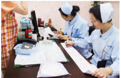
9:00 胎心监护室护士在认真观察胎心，宝贝生命的一丝一毫变化，都逃不过她们的火眼金睛